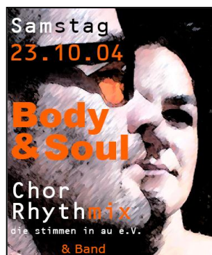
„Body & Soul“ Oktober 2004